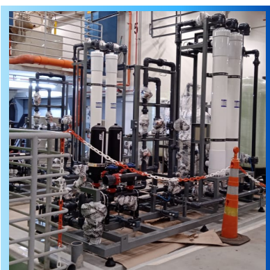
Sistema de filtração utilizando Filtros Disco