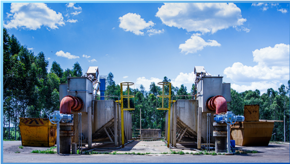
Sistema completo de tratamento preliminar de esgotos sanitários compreendendo: Peneiramento, Desarenação e Separação de gordura

A VIBROPAC, através de sua Divisão de Tratamento de Águas e Efluentes, é hoje reconhecida no mercado como uma das principais empresas no segmento, desenvolvendo produtos e sistemas completos que solucionam, com eficiência, quaisquer necessidades. Com tecnologia própria e com Acordos de Cooperação Técnico-Comercial com renomados fabricantes internacionais, conta com uma completa linha de equipamentos e sistemas além de comercializar Bombas Dosadoras Milton Roy, Bombas Pneumáticas Yamada e Controladores Digitais de Processos.