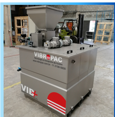
Sistema automatizado para preparo e dosagem de polímero