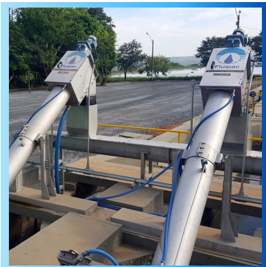
Peneiras verticais em tratamento preliminar de esgotos sanitários