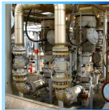
Compressores Centrífugos API 617