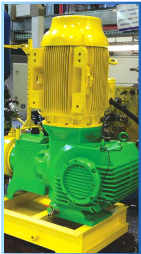
Bombas Dosadora API 675