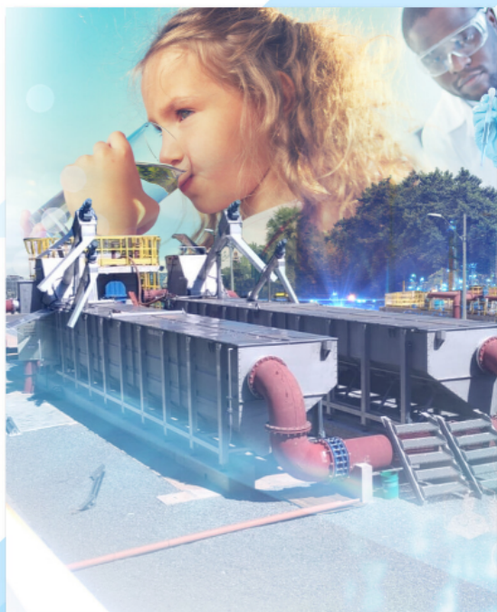
TRATAMENTO DE ÁGUAS E EFLUENTES +++