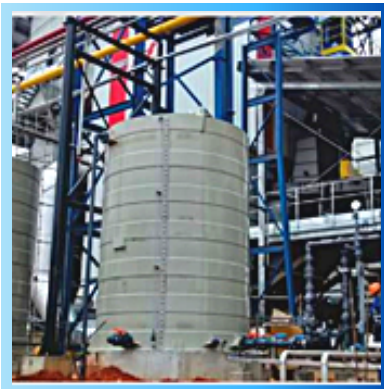
Sistema de tratamento de água de caldeira com filtração por Osmose Reversa