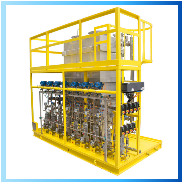
Sistema de Injeção Química destinado à Plataforma de Petróleo

A VIBROPAC, através de sua Divisão de Movimentação de Fluidos, se especializou em soluções para as áreas de extração e refino de petróleo, com a fabricação de Sistemas de Injeção Química e Odorizadores de Gases, bem como, como fornecimento de Bombas de Acoplamento Magnético, Bombas Centrífugas de Alta Pressão API 610, Bombas de Fusos Multifásicas e Compressores Centrífugos API 617.