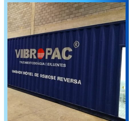
Vista interna de Unidade Móvel de Sistema de Osmose Reversa