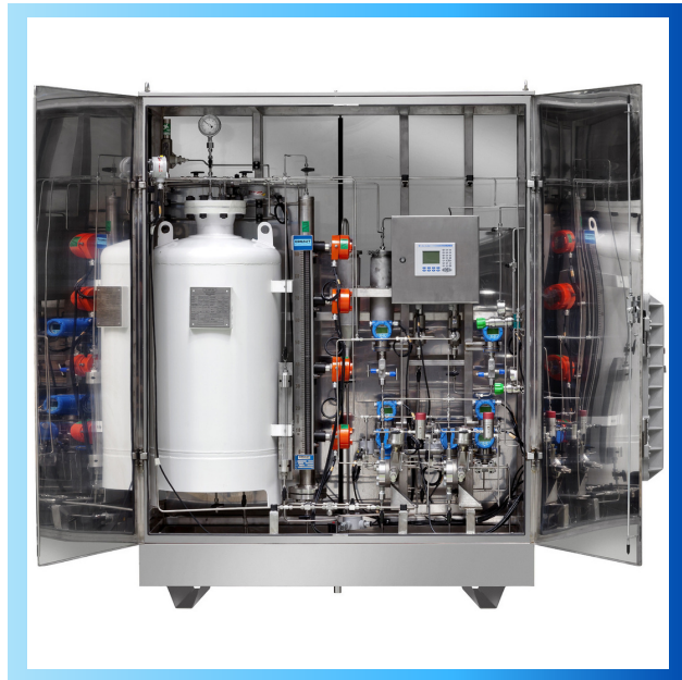
Sistema de Odorização de Gás