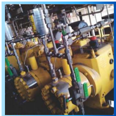
Bombas Dosadoras API 675