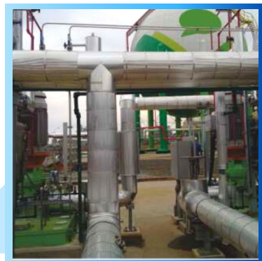
Bombas Centrífugas API 610