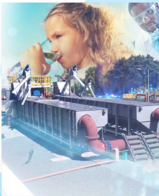
TRATAMENTO DE ÁGUAS E EFLUENTES +++